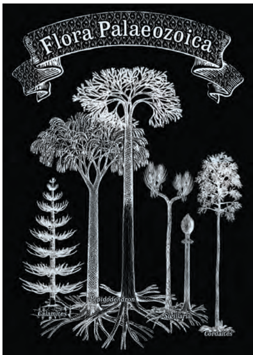
Fig. 1. Exhibition logo "Flora Palaeozoica" by Dr Vanja Stamenković, Senior Garden Curator./ Logo izložbe "Flora Palaeozoica" nacrtao je dr. sc. Vanja Stamenković, stručni savjetnik u Botaničkom vrtu.