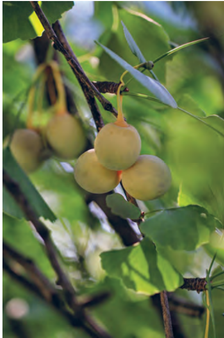
Fig. 6. Maidenhair tree ( Ginkgo biloba L.) is a single living descendant of the gymnosperm Ginkgoaceae family, which appeared in Mesozoic. It is commonly grown in parks and gardens around the world./ Ginko ( Ginkgo biloba L.) je jedini preživjeli član pradaвне porodice golosjemenjača (Ginkgoaceae), koja se razvila još u ranom mezozoiku. Česta je uzgojna vrsta diljem svijeta.