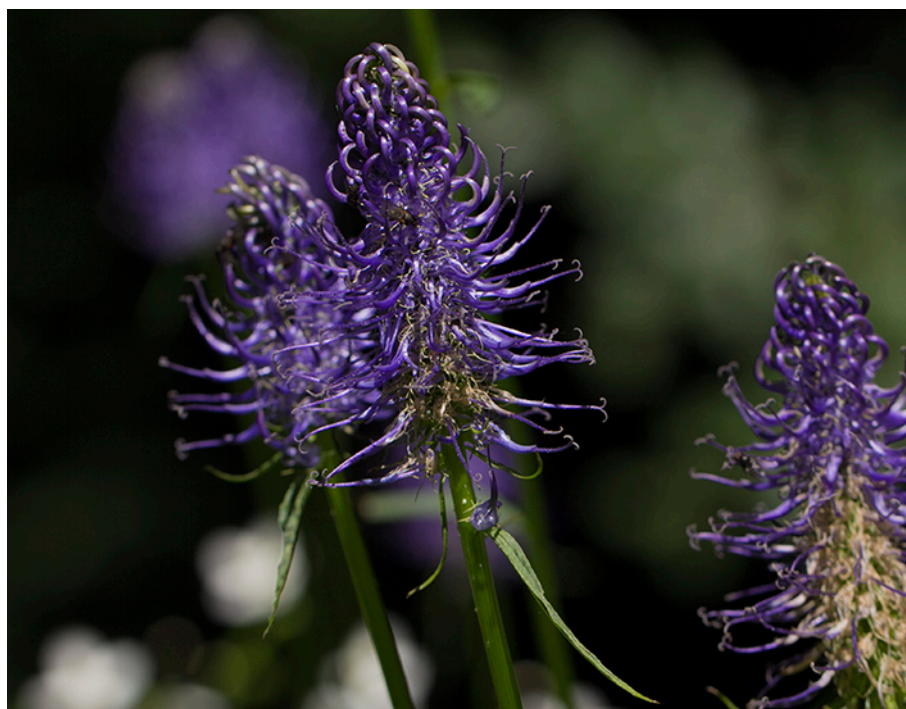
Phyteuma spicatum L., The Risnjak Mountain NP