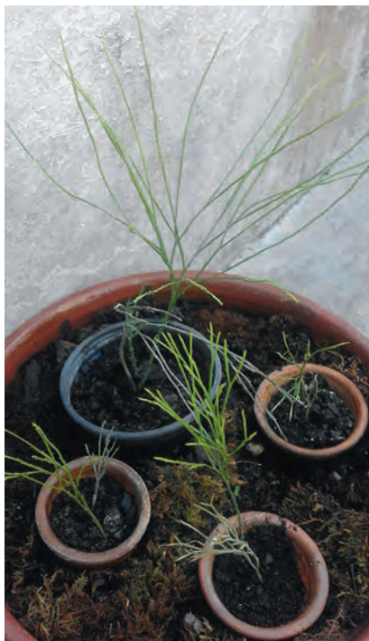
Fig. 2. Primitive whisk fern ( Psilotum nudum (L.) P. Beauv.) from our Botanical Garden collection (courtesy of the Botanical Garden of Eötvös University, Budapest). Still resembling the earliest plants from late Silurian, these primitive ferns are actually of more recent ancestry. / Primitivna metličasta paprat ( Psilotum nudum (L.) P. Beauv.) iz zbirke našeg Botaničkog vrta (dobivena na dar iz Botaničkog vrta Sveučilišta Eötvös u Budimpešti) izgledom podsjeća na najstarije kopnene biljke s kraja silura, no zapravo je modernijeg podrijetla.