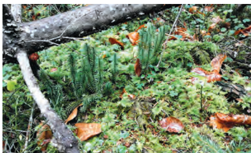
Fig. 3. How the ancient forest ground floor might have look like, it is not hard to imagine even today, in the conifer woods of Croatian Gorski kotar region: ancient mosses and clubmosses were among the first true land plants evolved in Palaeozoic./ Kako je moglo izgledati šumsko tlo u pradávná vremena možemo si zamisliti čak i danas, primjerice u crnogoričnim šumama našega Gorskog kotara: među prvim pravim kopnenim biljkama bile su drevne mahovine i crvotočine, koje svoje podrijetlo vuku još iz paleozoika.