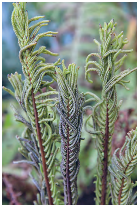
Fig. 4. Ferns were certainly the first vascular plants evolved on Earth (Silurian), still abundantly present today. The monotypic ostrich fern ( Matteuccia struthiopteris (L.) Tod. – fertile fronds) is one of the many fern taxa grown in Botanical Garden today, both outdoor and indoor./ Paprati su prve prave vaskularne kopnene biljke na Zemlji, koje su se razvile tijekom silura, a njihovi su potomci rašireni planetom i danas. Monotipska smeđa stela ( Matteuccia struthiopteris (L.) Tod. – fertilni listovi) jedna je od mnogobrojnih paprati iz zbirki Botaničkog vrta, koje danas uzgajamo u staklenicima i na otvorenom.