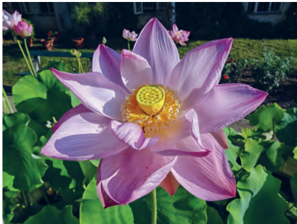
Fig. 7. Water lilies (Nymphaeaceae, incl. Nelumbonaceae), such as this sacred lotus ( Nelumbo nucifera Gaertn.) from the Garden collection, evolved in Cretaceous. They are suggested to be the earliest angiosperms on Earth, still present today./ Lopočevke (porodica Nymphaeaceae, uklj. Nelumbonaceae), kojima pripada i lotos ( Nelumbo nucifera Gaertn.) iz vrtne zbirke, potječu još iz krede. Smatra se da pripadaju najstarijoj razvojnoj liniji kritosjemenjača, koje su malo promijenjene preživjele sve do današnjih dana.